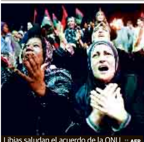
Libias saludan el acuerdo de la ONU.