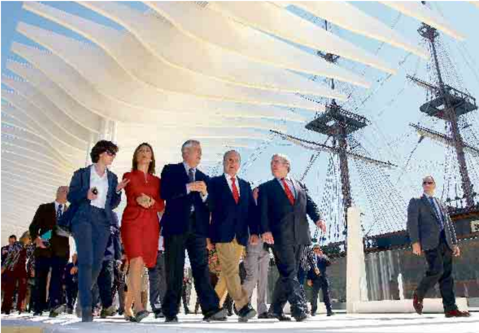
El presidente andaluz, con el alcalde de Málaga, la delegada de la Junta, el presidente de la Diputación y la jefa de Gabinete.