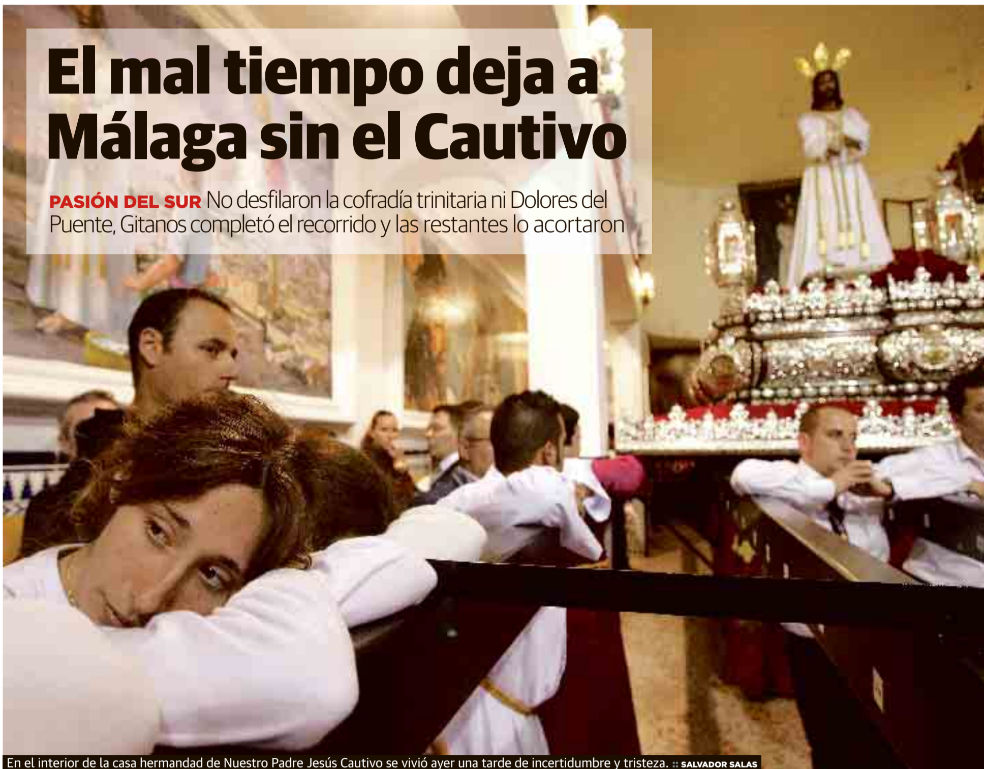
En el interior de la casa hermandad de Nuestro Padre Jesús Cautivo se vivió ayer una tarde de incertidumbre y tristeza.

PASIÓN DEL SUR No desfilaron la cofradía trinitaria ni Dolores del Puente, Gitanos completó el recorrido y las restantes lo acortaron