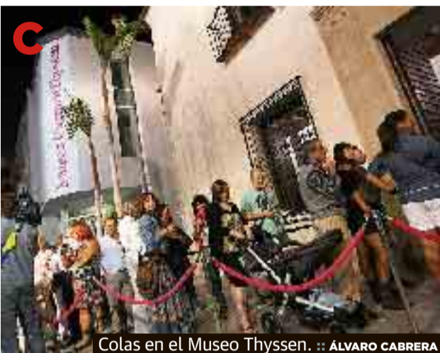
Colas en el Museo Thyssen.

A LORCA, EL INFIERNO AL OTRO LADO DEL TELÉFONO P48