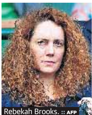
Rebekah Brooks.