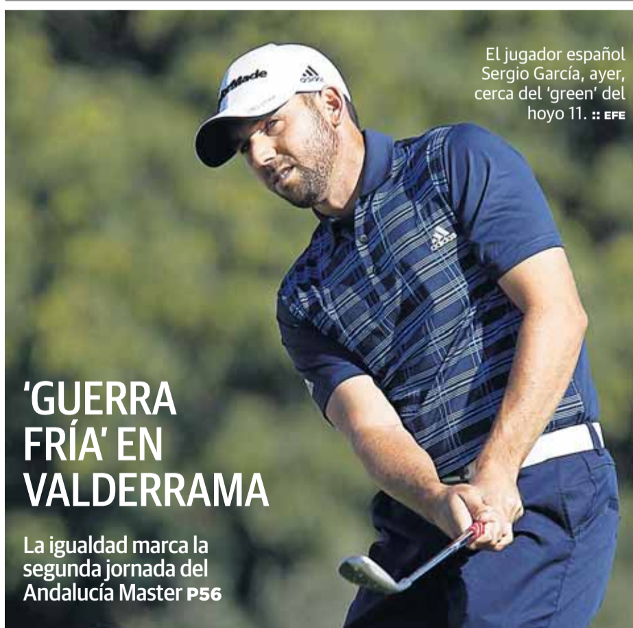
El jugador español Sergio García, ayer, cerca del 'green' del hoyo 11.

ES EL NÚMERO TOTAL DE PARADOS EN ESPAÑA, EL PEOR DATO DE LA HISTORIA