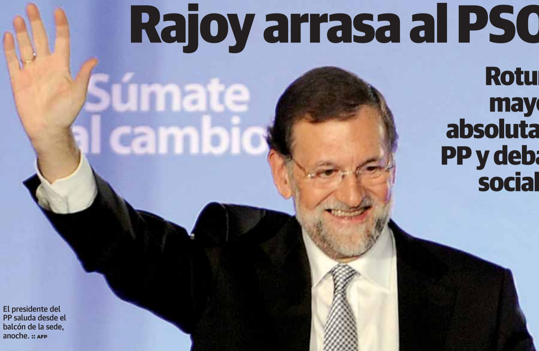
El presidente del PP saluda desde el balcón de la sede, anoche.

Rotunda mayoría absoluta del PP y debacle socialista