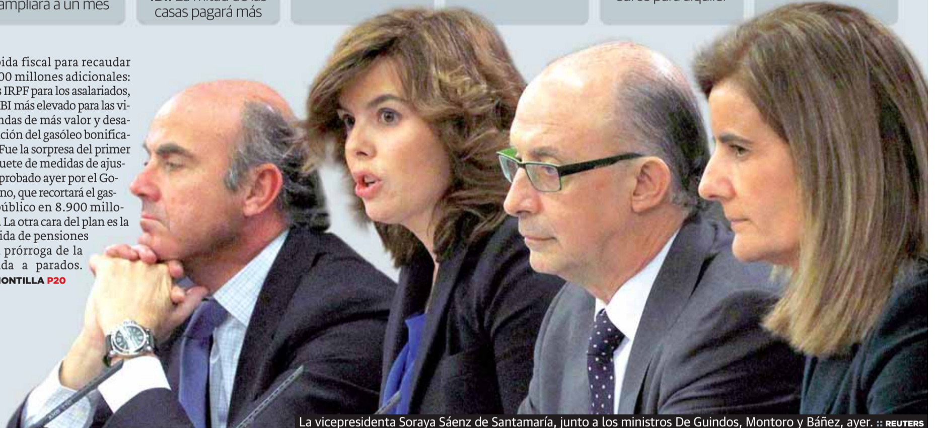
La vicepresidenta Soraya Sáenz de Santamaría, junto a los ministros De Guindos, Montoro y Báñez, ayer.