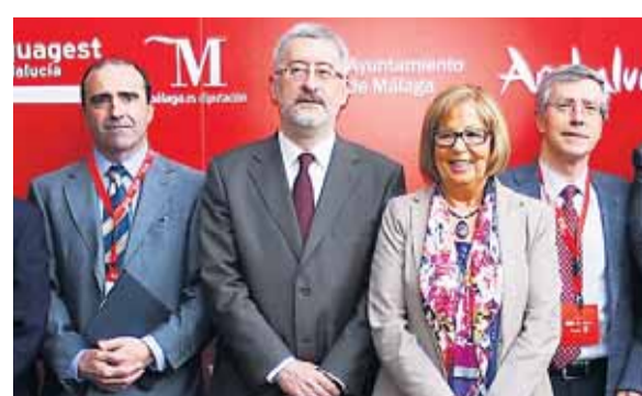
La rectora De la Calle y el consejero Ávila, ayer.