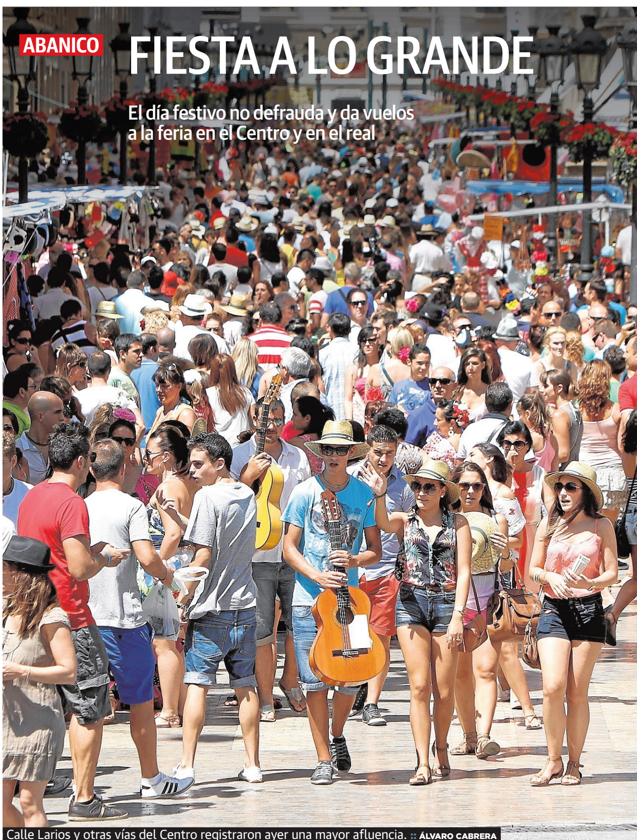
Calle Larios y otras vías del Centro registraron ayer una mayor afluencia.

El día festivo no defrauda y da vuelos a la feria en el Centro y en el real