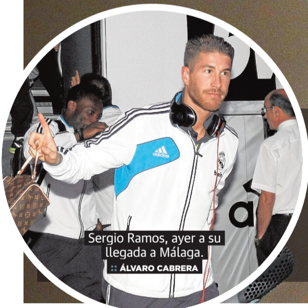
Sergio Ramos, ayer a su llegada a Málaga.