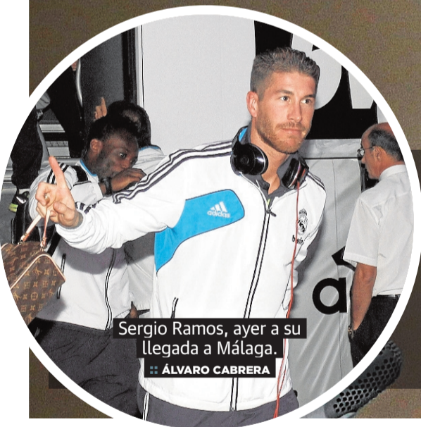
Sergio Ramos, ayer a su llegada a Málaga.