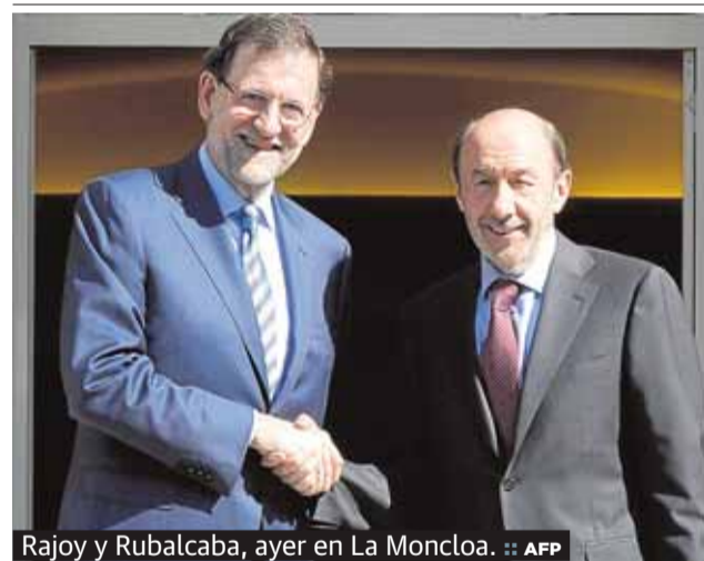
Rajoy y Rubalcaba, ayer en La Moncloa.

có hace una semana que 1.349 universitarios malagueños no pueden seguir sus estudios al haberse quedado sin ayuda y no poder pagar la matrícula. P2