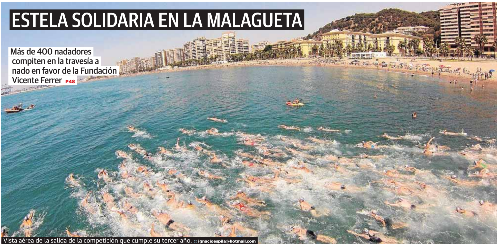
Vista aérea de la salida de la competición que cumple su tercer año.

Más de 400 nadadores compiten en la travesía a nado en favor de la Fundación Vicente Ferrer P48