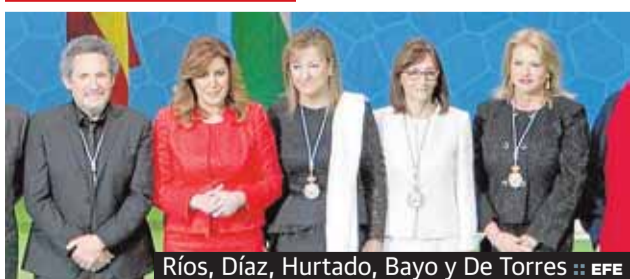
Ríos, Díaz, Hurtado, Bayo y De Torres :: EFE

mes de enero tumbó parte de la protección impuesta a dos suelos de 75.000 metros cuadrados en Puerto de la Torre, junto a la Hiperronda, y que permiten de hecho urbanizar esa zona. P2