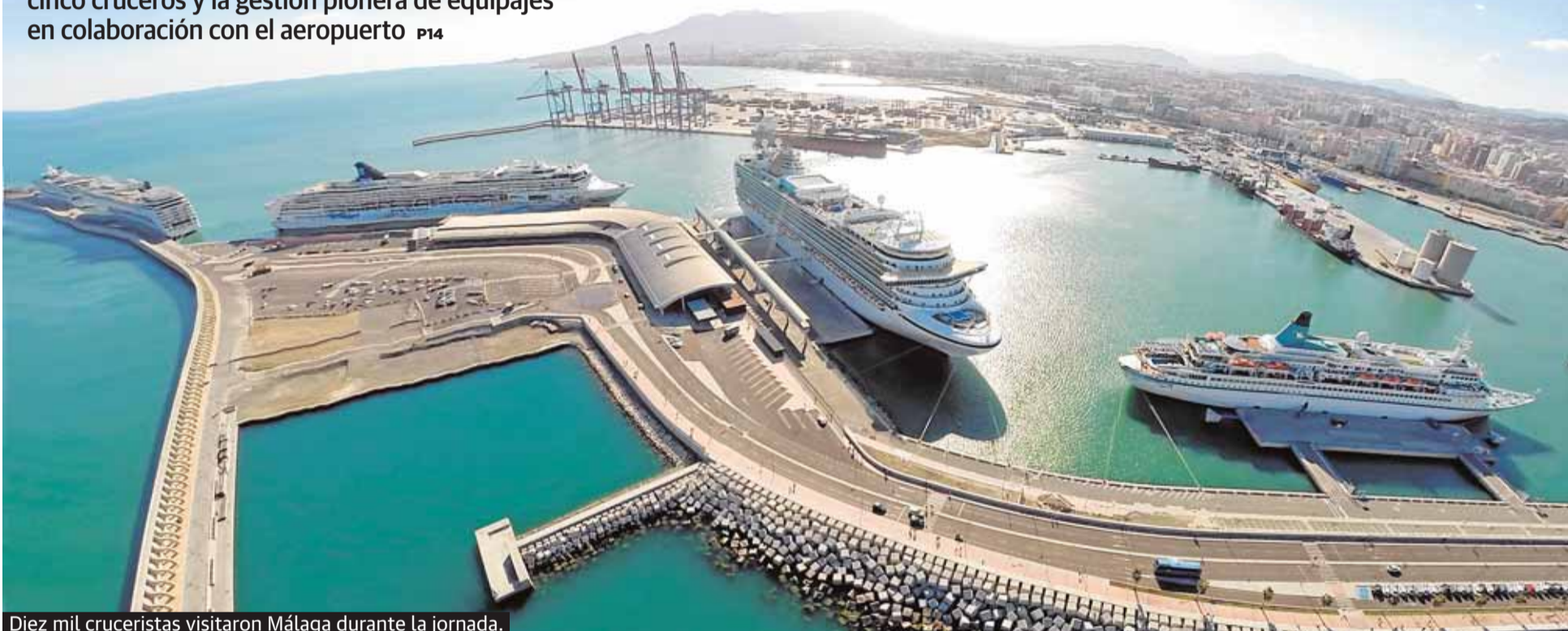
Diez mil cruceristas visitaron Málaga durante la jornada.

La ciudad vive una jornada sin precedentes con cinco cruceros y la gestión pionera de equipajes en colaboración con el aeropuerto P14