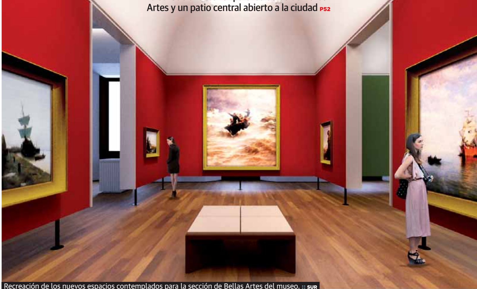
Recreación de los nuevos espacios contemplados para la sección de Bellas Artes del museo.

El Palacio de la Aduana ofrecerá una nueva distribución interior para las obras de Bellas Artes y un patio central abierto a la ciudad P52