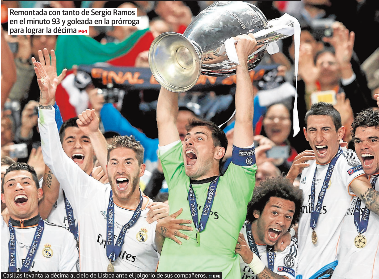
Casillas levanta la décima al cielo de Lisboa ante el jolgorio de sus compañeros.

Remontada con tanto de Sergio Ramos en el minuto 93 y goleada en la prórroga para lograr la décima P64