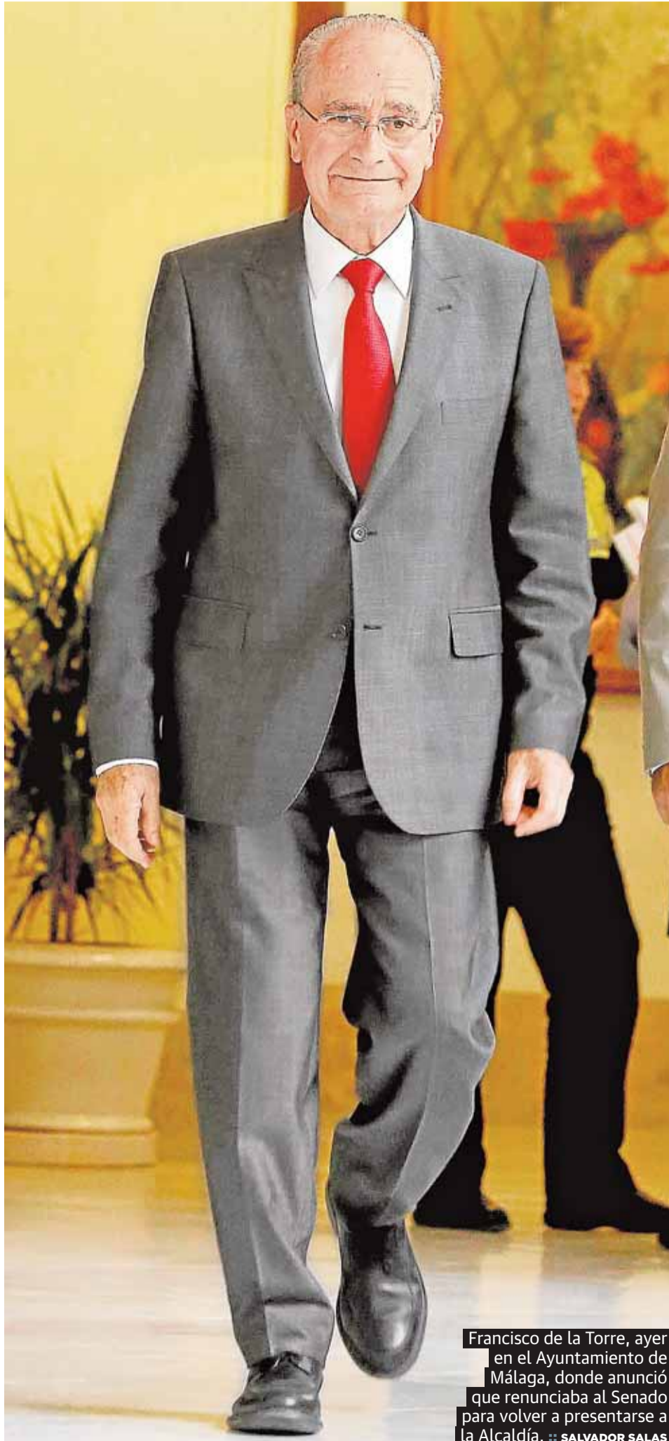
Francisco de la Torre, ayer en el Ayuntamiento de Málaga, donde anunció que renunciaba al Senado para volver a presentarse a la Alcaldía.

si revalida la mayoría y la salud se lo permite, agotará el que sería su quinto mandato. Después del toque de atención de las pasadas europeas que supuso para el PP su primera derrota en la capital en una década y con una encuesta que le augura una mayoría absoluta muy justa (16 de los 31 concejales, frente a los 19 actuales), el regidor cambia de estrategia consciente de que para conservar la vara de mando en 2015 hace falta más calle y una mayor dedicación a los problemas de los barrios. P2