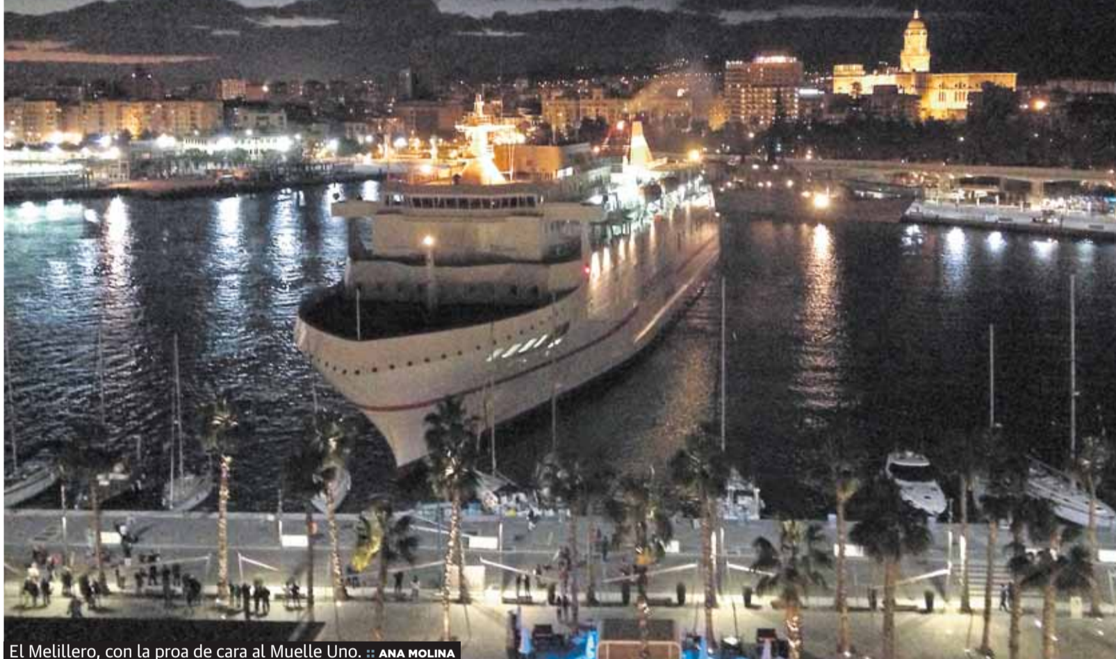
El Melillero, con la proa de cara al Muelle Uno.

El buque 'Juan J. Sister' perdió el control cuando maniobraba y chocó contra el cantil del puerto y un velero al que ocasionó graves daños P3