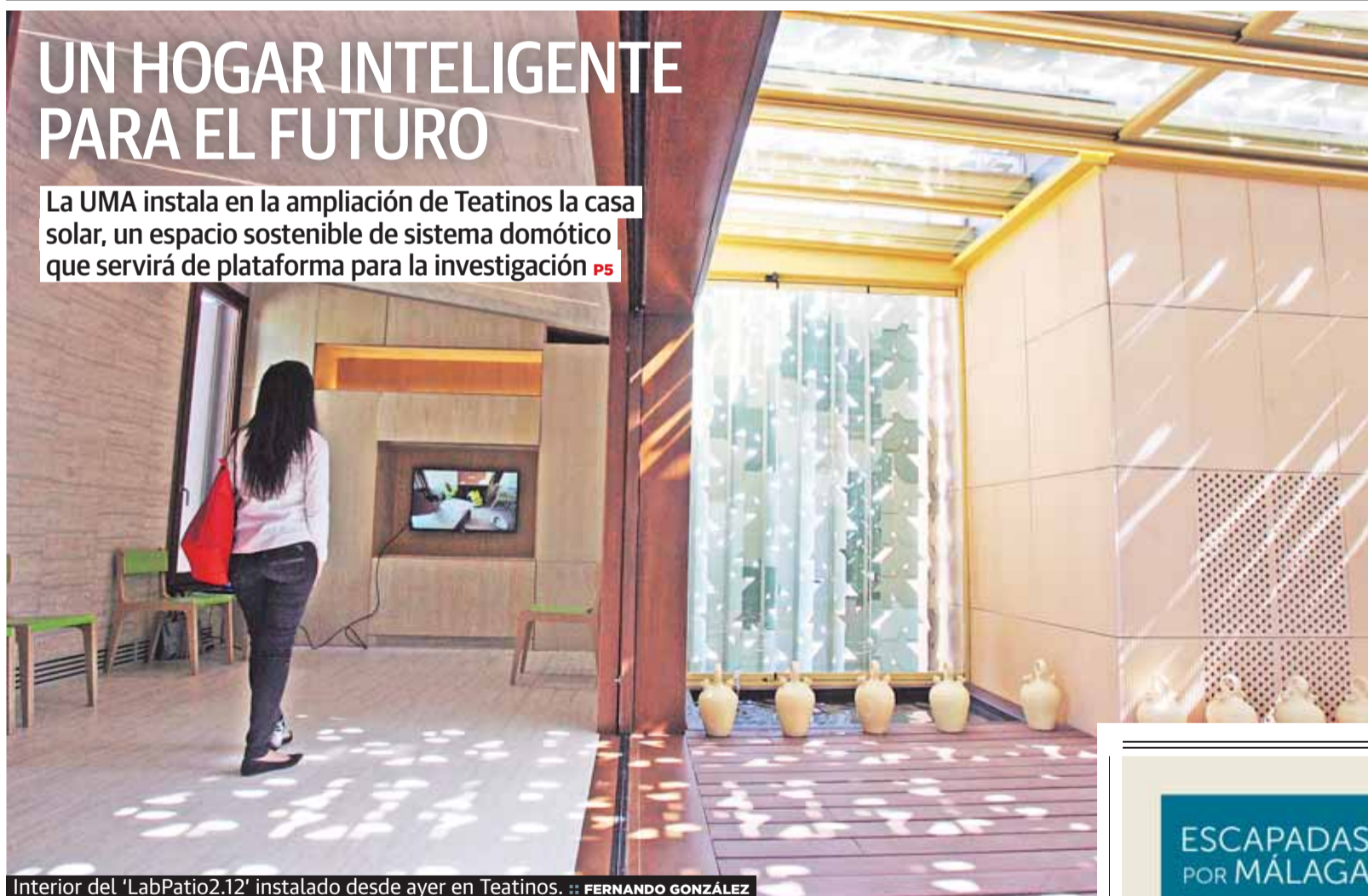
Interior del 'LabPatio2.12' instalado desde ayer en Teatinos.

La UMA instala en la ampliación de Teatinos la casa solar, un espacio sostenible de sistema domótico que servirá de plataforma para la investigación P5