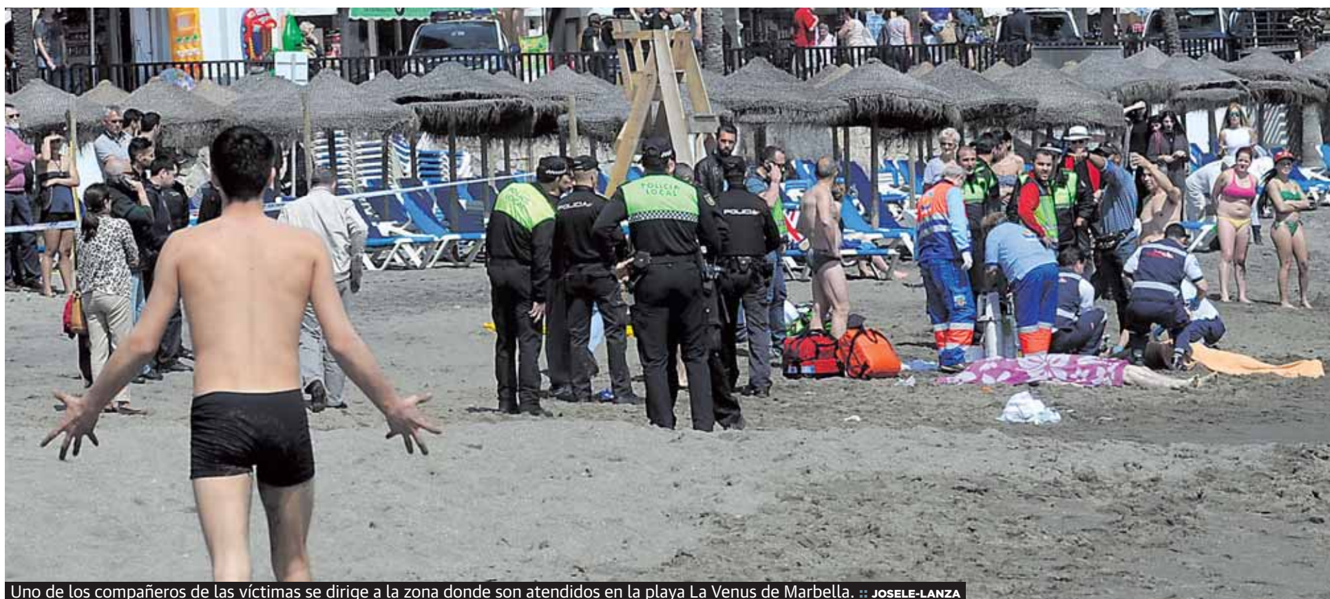
Uno de los compañeros de las víctimas se dirige a la zona donde son atendidos en la playa La Venus de Marbella.

de estudios, entre los que hay algunos alumnos sordomudos, que habían llegado a Marbella el pasado 5 de abril acompañados por dos monitores. P2