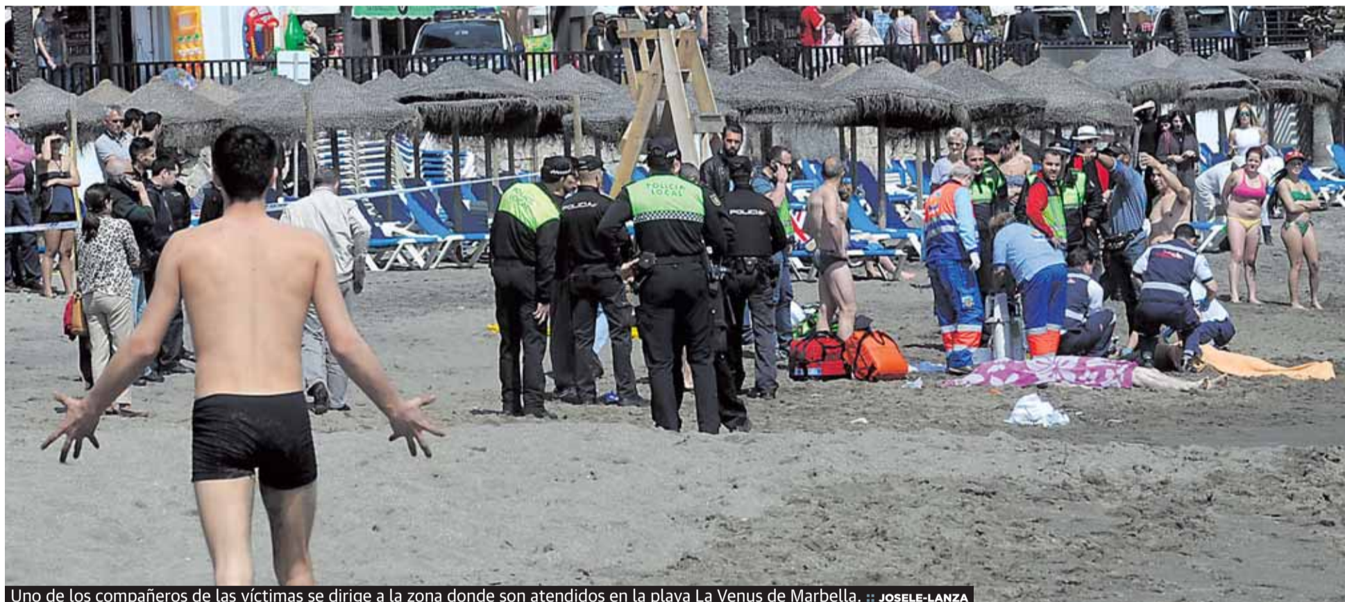
Uno de los compañeros de las víctimas se dirige a la zona donde son atendidos en la playa La Venus de Marbella.

de estudios, entre los que hay algunos alumnos sordomudos, que habían llegado a Marbella el pasado 5 de abril acompañados por dos monitores. P2