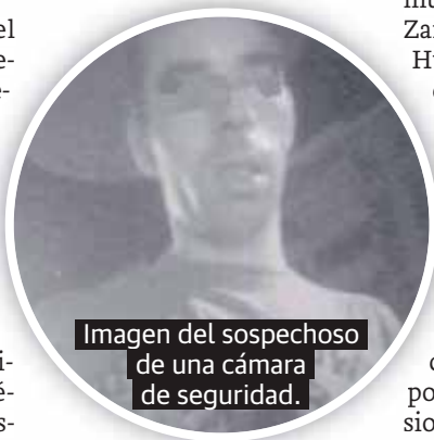
Imagen del sospechoso de una cámara de seguridad.