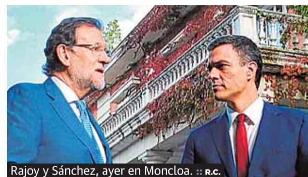
Rajoy y Sánchez, ayer en Moncloa.

que al Estado. Los socialistas y el Gobierno se han comprometido a trabajar «coordinadamente en la defensa de la Constitución y de la unidad nacional», según el comunicado pactado entre ambos. A este frente común se incorporará en breve el líder de Ciudadanos, Albert Rivera. No así Podemos porque, según el Gobierno, defiende el «derecho de autodeterminación». P30