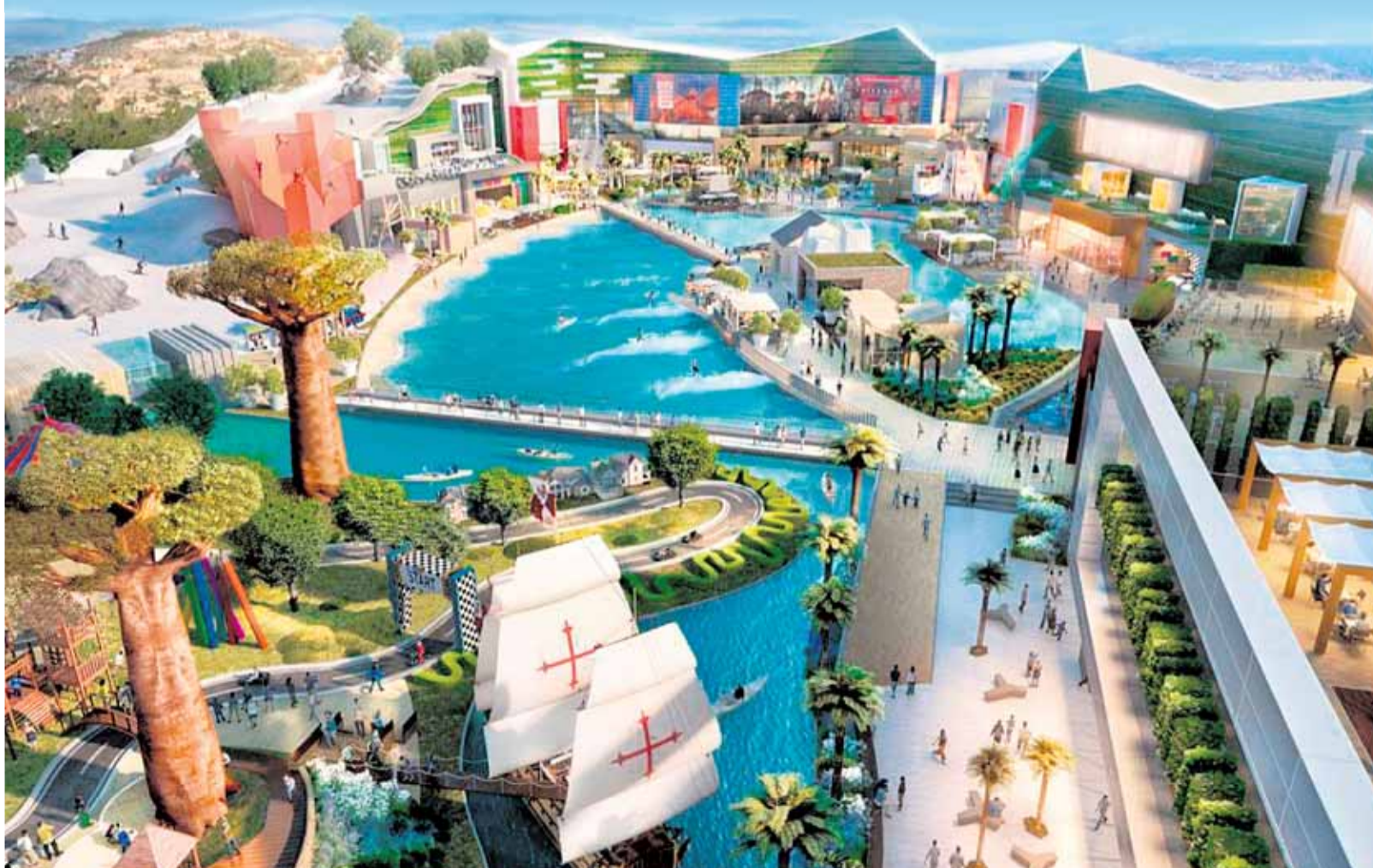
Recreación del centro comercial y de ocio que la empresa Intu Properties proyecta entre el Palacio de Congresos y el acceso a la autovía. :: SUR

El proyecto, al que el Ayuntamiento quiere dar vía libre en noviembre, incluye una pista de esquí y una piscina de olas gigantes para hacer surf P8