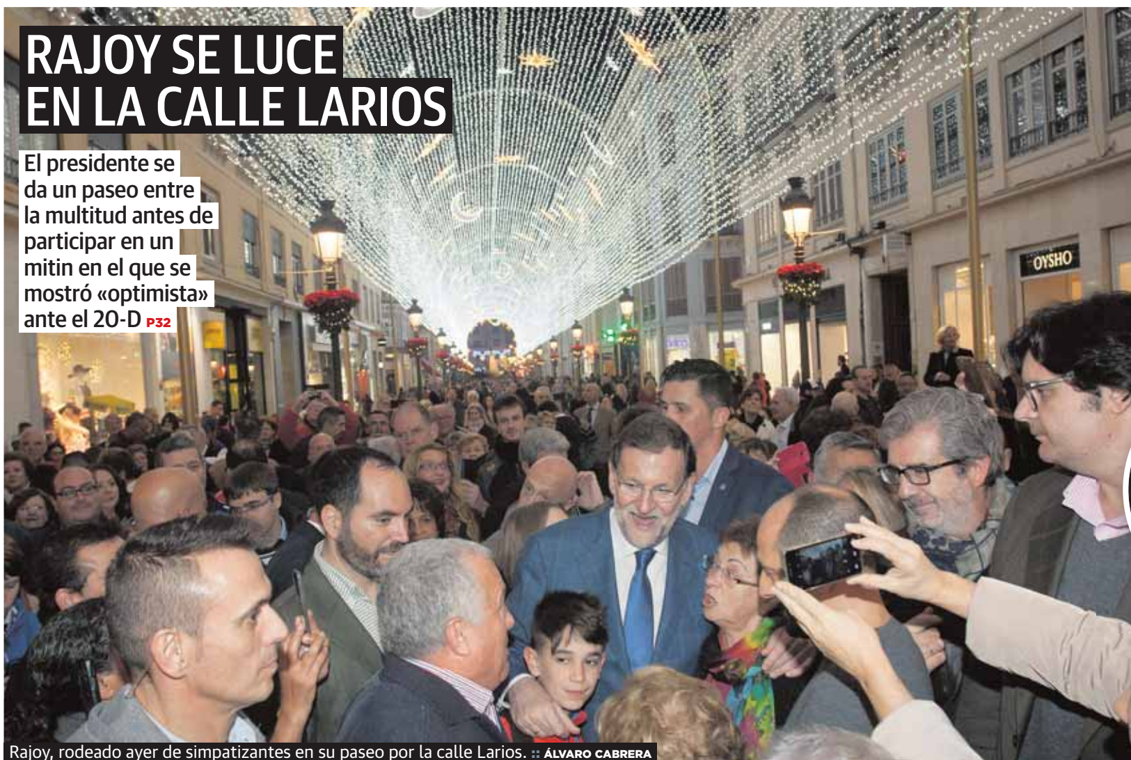
Rajoy, rodeado ayer de simpatizantes en su paseo por la calle Larios. ÁLVARO CABRERA

El presidente se da un paseo entre la multitud antes de participar en un mitin en el que se mostró «optimista» ante el 20-D P32