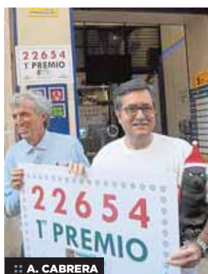
:: A. CABRERA

22654, agraciado con el primer premio, viajó hasta numerosas localidades. La mayor parte fue vendida en Guipúzcoa, donde una administración de Pasajes pudo haber dejado en el municipio 36 millones. P6