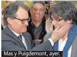
Mas y Puigdemont, ayer.

El acuerdo 'in extremis' convertirá en presidente de Cataluña al alcalde de Gerona, Carles Puigdemont