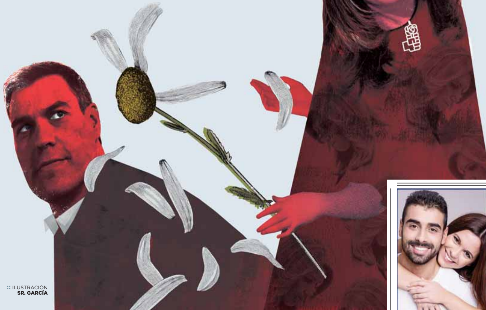
ILUSTRACIÓN SR. GARCÍA

La presidenta andaluza no pasa, de momento, del amago de dar el salto a la política nacional pese a estar convencida de contar con respaldos P24