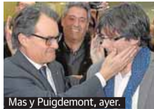
Mas y Puigdemont, ayer.

El acuerdo 'in extremis' convertirá en presidente de Cataluña al alcalde de Gerona, Carles Puigdemont