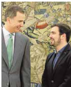
El Rey y Garzón, ayer.

El entorno de Rajoy avisa de que sólo dará un paso atrás si los socialistas confirman un pacto