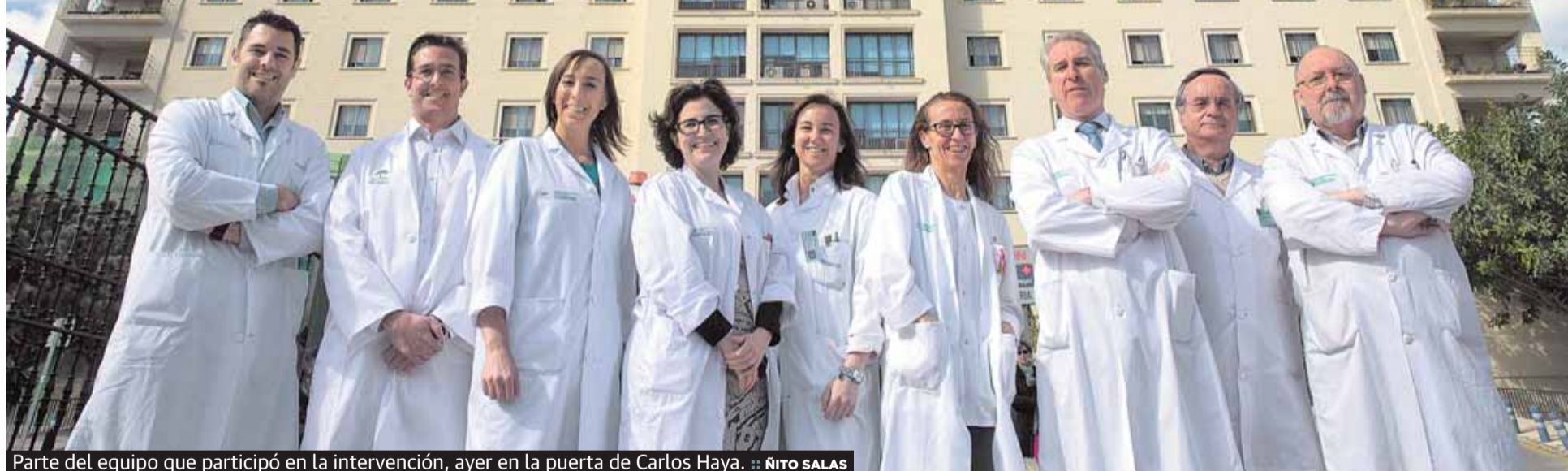
Parte del equipo que participó en la intervención, ayer en la puerta de Carlos Haya.

Andalucía reconoce al equipo de Carlos Haya que extirpó un tumor cerebral a un joven que tocó el saxo mientras era intervenido P25