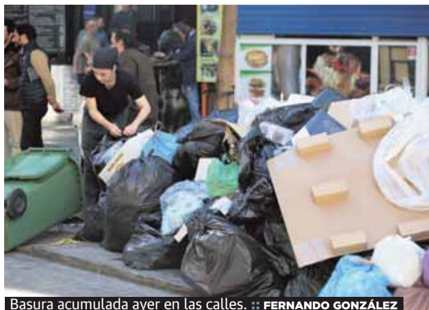
Basura acumulada ayer en las calles.

433 euros de paga de productividad y una semana de vacaciones de verano), es el clima de conflicto el principal escollo. Buena prueba de ello es la escenificación del encuentro entre ambas partes ayer en La Caja Blanca, el territorio 'neutro' escogido para la negociación. 47 minutos escasos fueron los que tardaron los representantes sindicales en levantarse de la mesa. El concejal del ramo abandonó el encuentro escoltado por la policía y entre abucheos. P2 A 4