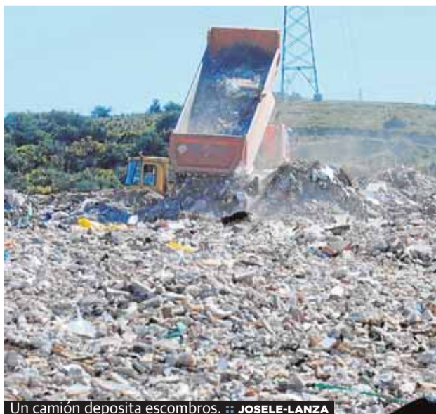
Un camión deposita escombros.