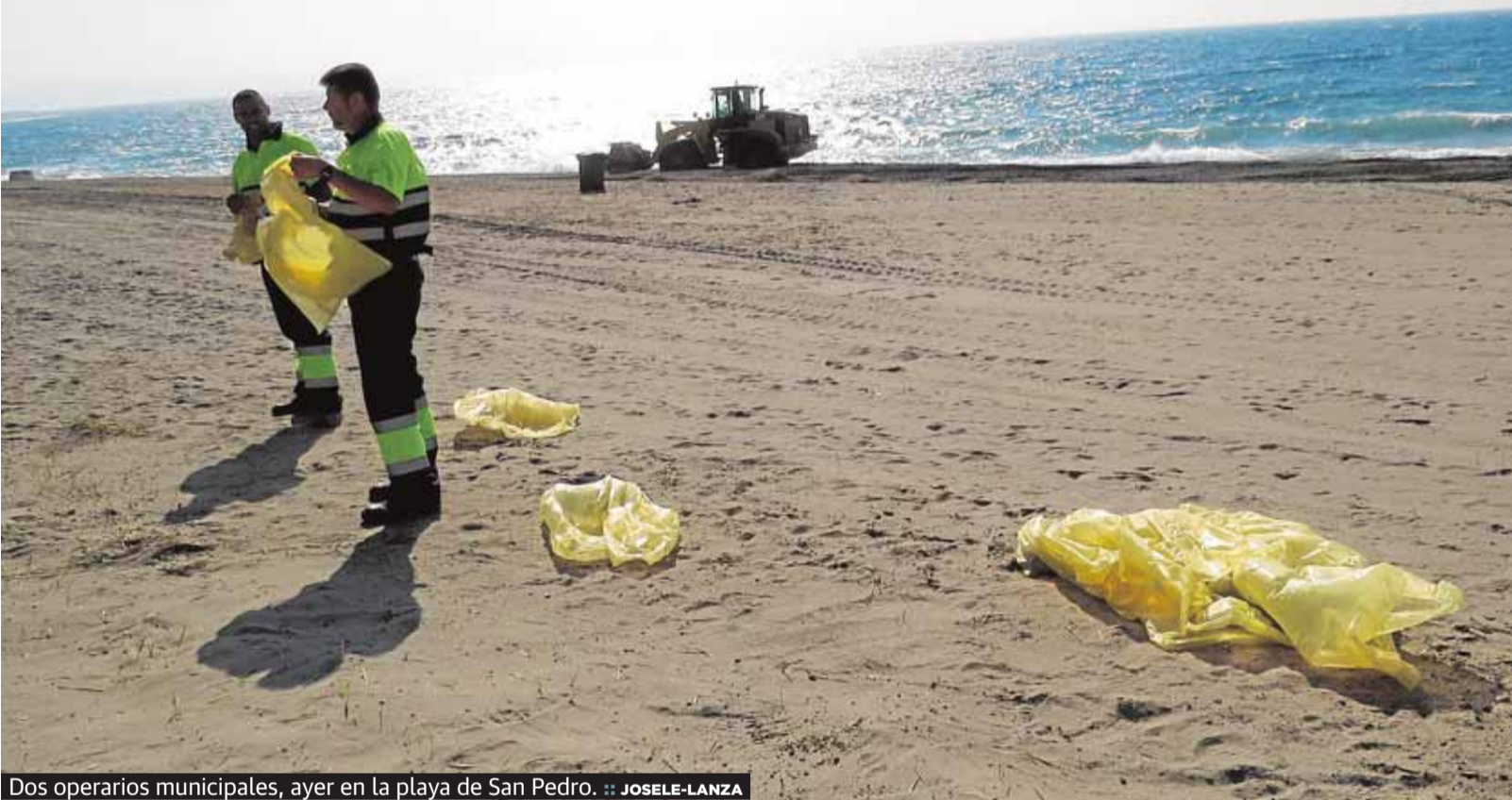
Dos operarios municipales, ayer en la playa de San Pedro.

Las playas del centro de Marbella han recibido 13.000 metros cúbicos de arena y en San Pedro se retiran piedras P6