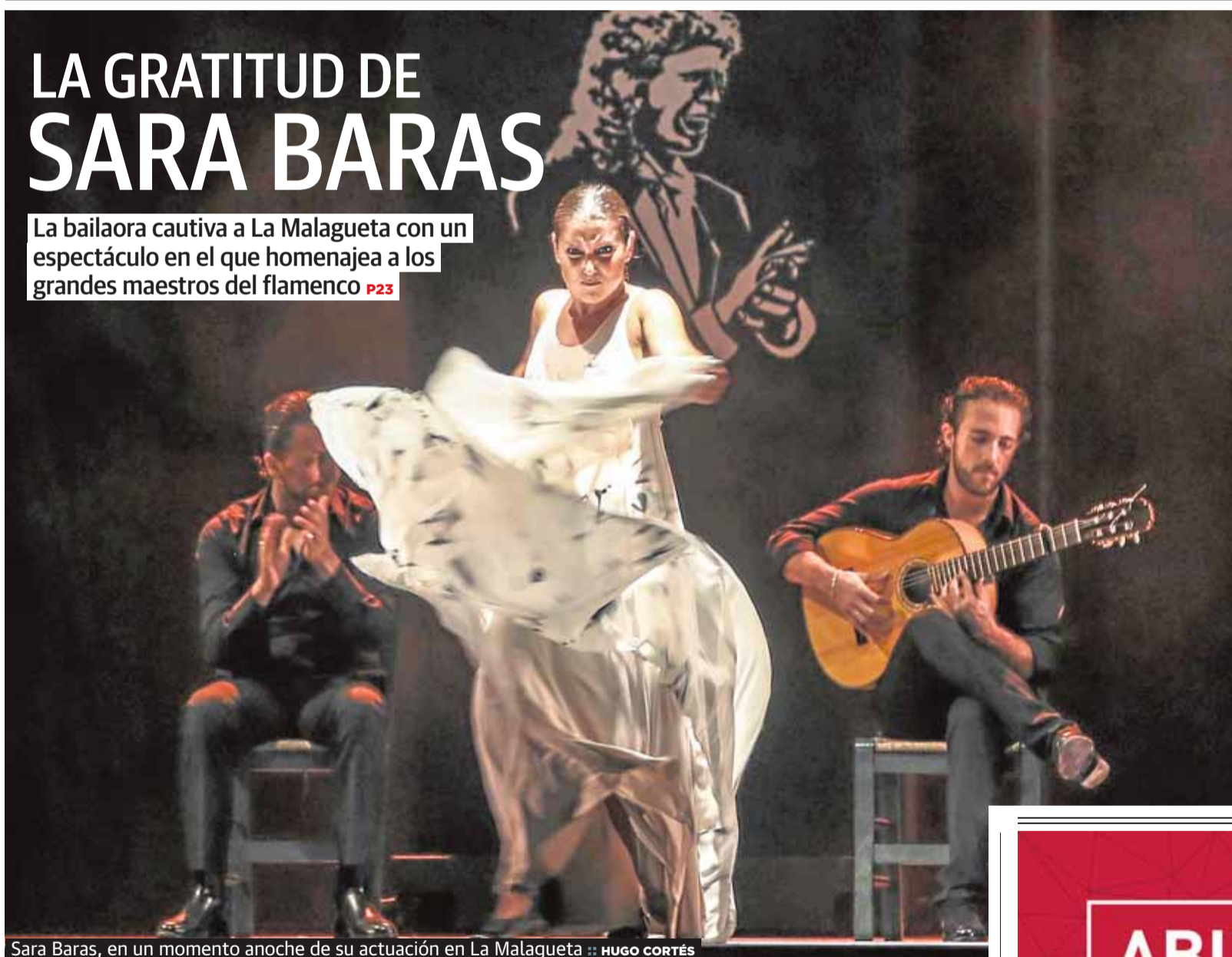
Sara Baras, en un momento anoche de su actuación en La Malagueta

La bailaora cautiva a La Malagueta con un espectáculo en el que homenajea a los grandes maestros del flamenco P23