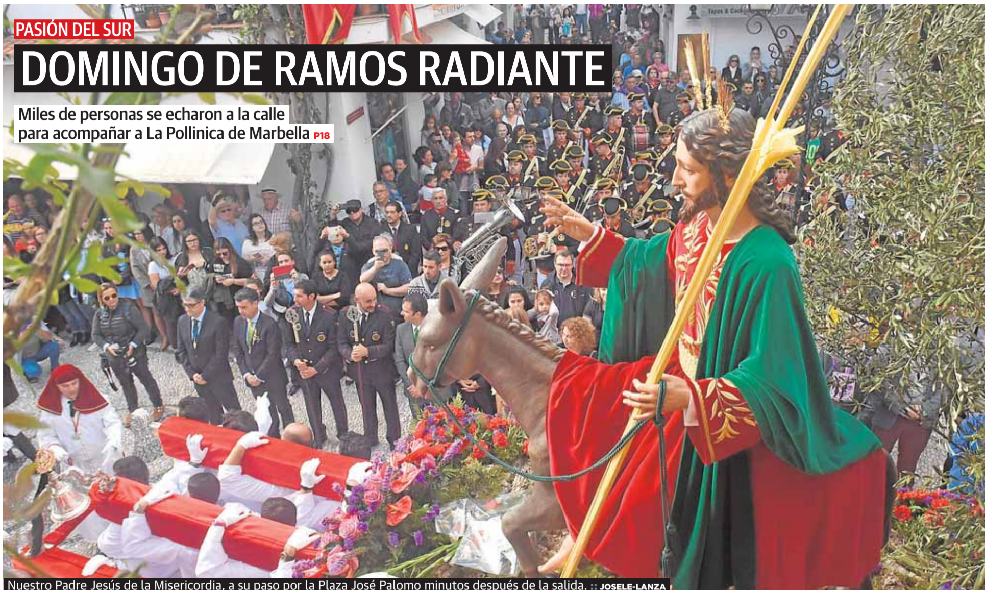
Nuestro Padre Jesús de la Misericordia, a su paso por la Plaza José Palomo minutos después de la salida.

Miles de personas se echaron a la calle para acompañar a La Pollinica de Marbella P18