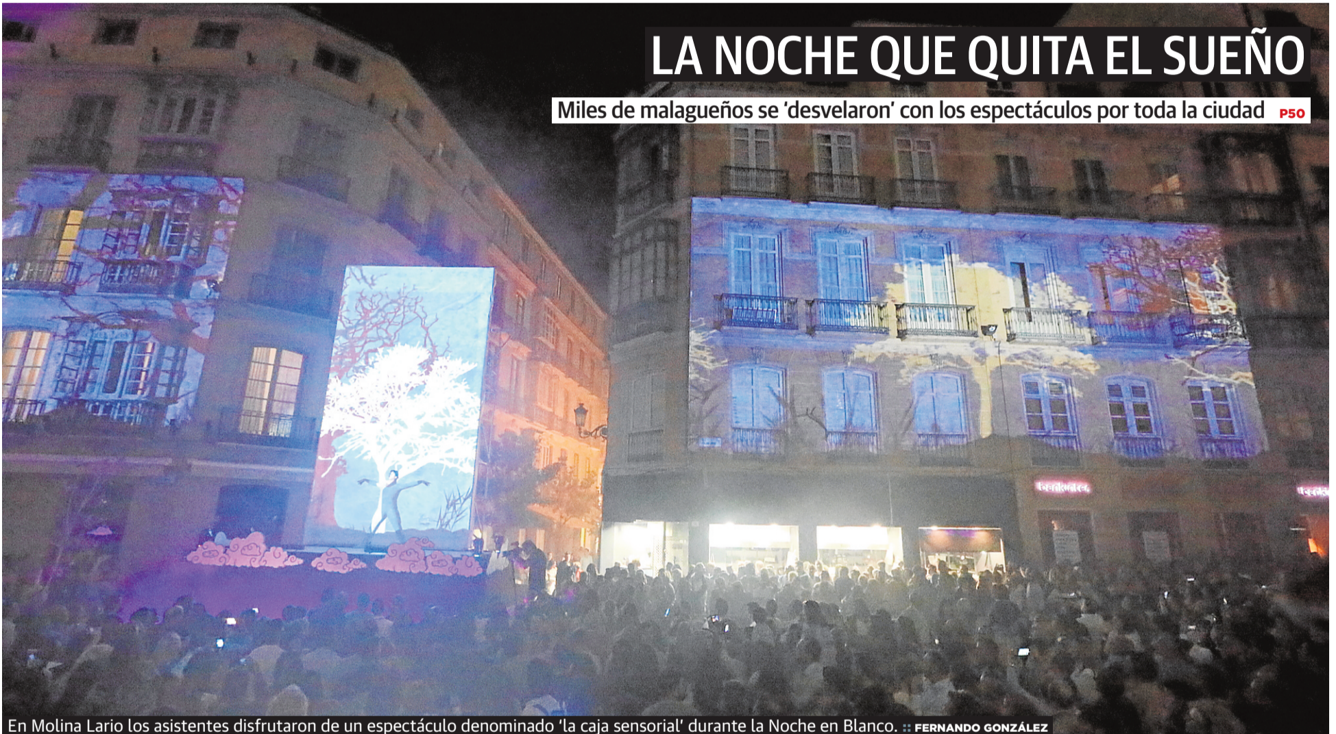
En Molina Lario los asistentes disfrutaron de un espectáculo denominado 'la caja sensorial' durante la Noche en Blanco.

Miles de malagueños se 'desvelaron' con los espectáculos por toda la ciudad P50