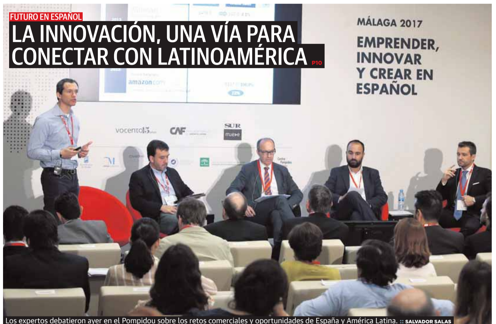
Los expertos debatieron ayer en el Pompidou sobre los retos comerciales y oportunidades de España y América Latina.

El futuro de la Escuela de Hostelería y Turismo Bellamar –el único centro formativo de sus características que sigue gestionando el Estado– está en el aire después de que la propiedad de los terrenos haya solicitado al Gobierno recuperar el suelo. Así lo han confirmado fuentes del Ejecutivo central que, no obstante, garantizan la continuidad de la actividad formativa. Las partes, indican, mantienen abierta una negociación con la idea de alcanzar un nuevo acuerdo. En caso de que no fructifiquen esas conversaciones, el Estado, aseguran, procedería a buscar una nueva ubicación. La Escuela Bellamar se encuentra en el actual emplazamiento, al pie de la avenida Severo Ochoa, desde que en el año 1969 se firmara un acuerdo de arrendamiento con los propietarios de los terrenos. P2