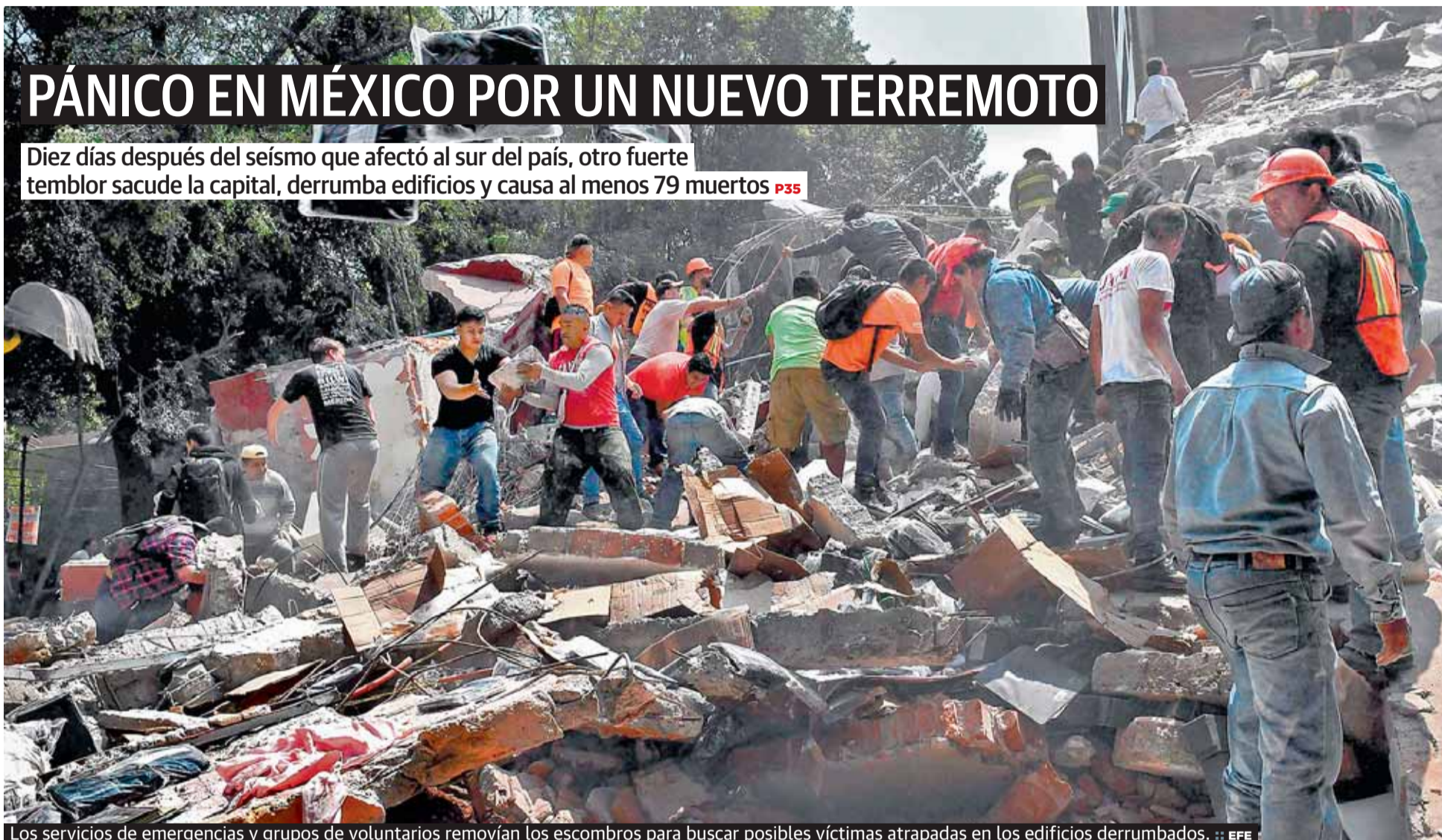
Los servicios de emergencias y grupos de voluntarios removían los escombros para buscar posibles víctimas atrapadas en los edificios derrumbados.

Diez días después del seísmo que afectó al sur del país, otro fuerte temblor sacude la capital, derrumba edificios y causa al menos 79 muertos P35