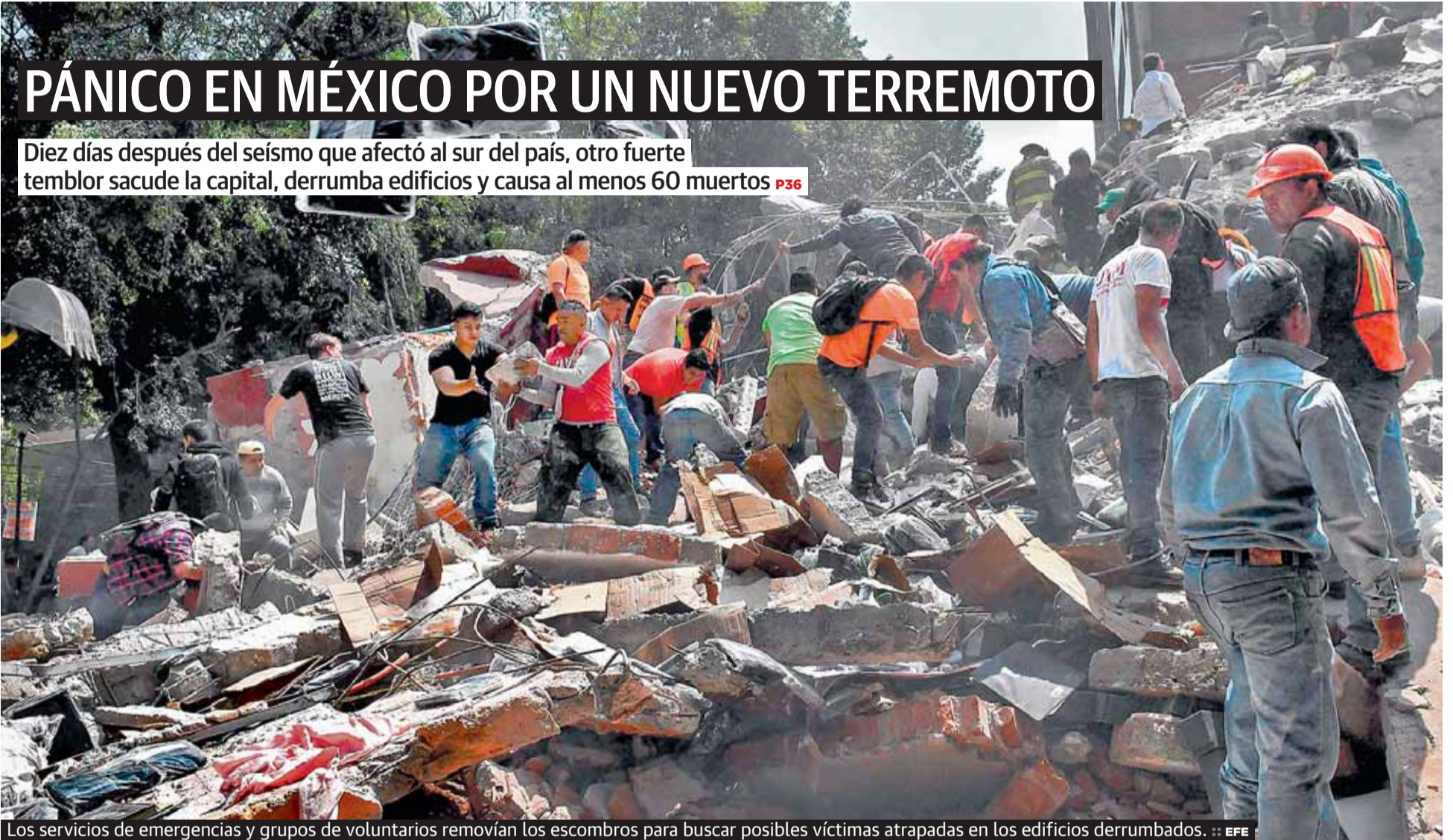
Los servicios de emergencias y grupos de voluntarios removan los escombros para buscar posibles víctimas atrapadas en los edificios derrumbados.

Diez días después del seísmo que afectó al sur del país, otro fuerte temblor sacude la capital, derrumba edificios y causa al menos 60 muertos P36