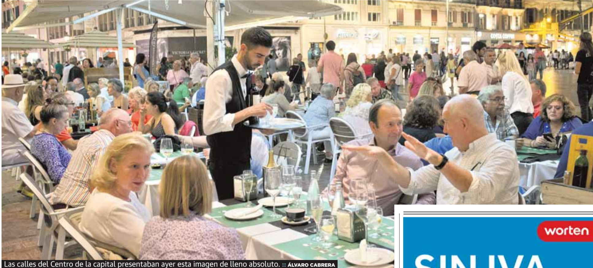
Las calles del Centro de la capital presentaban ayer esta imagen de lleno absoluto.

Málaga cerrará 2017 con 1,3 millones de viajeros tras un verano espectacular que marca una tendencia consolidada estos días con motivo de la celebración de la festividad del Pilar P14