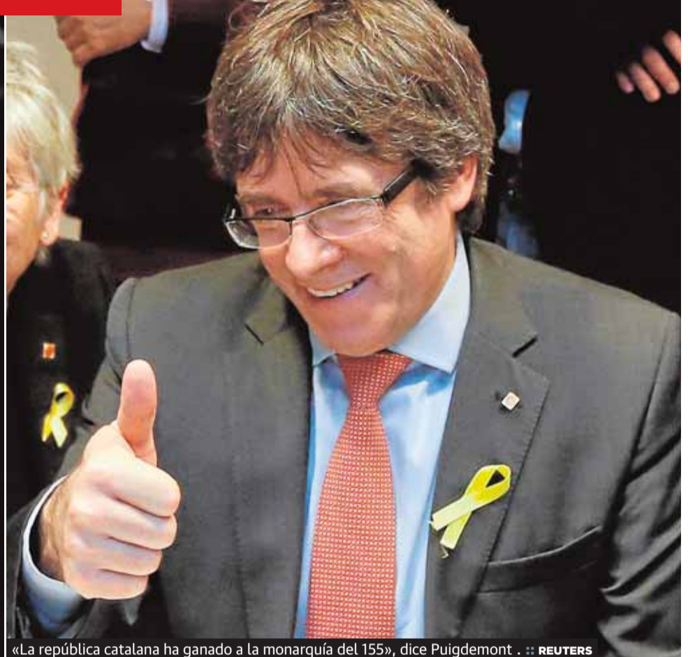
«La república catalana ha ganado a la monarquía del 155», dice Puigdemont .