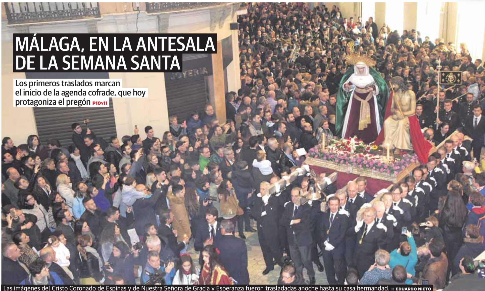
Las imágenes del Cristo Coronado de Espinas y de Nuestra Señora de Gracia y Esperanza fueron trasladadas anoche hasta su casa hermandad.

Los primeros traslados marcan el inicio de la agenda cofrade, que hoy protagoniza el pregón P10y11