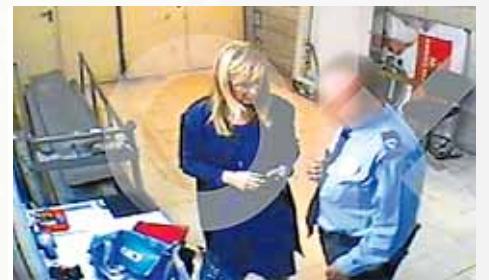
Cristina Cifuentes, ayer durante la rueda de prensa en la que anunció su dimisión.

Por dos botes de crema. Imagen del vídeo donde el vigilante retiene a Cifuentes por un hurto valorado en 40 euros.