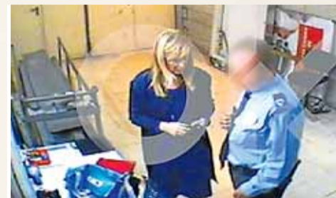
Cristina Cifuentes, ayer durante la rueda de prensa en la que anunció su dimisión.

Por dos botes de crema. Imagen del vídeo donde el vigilante retiene a Cifuentes por un hurto valorado en 40 euros.