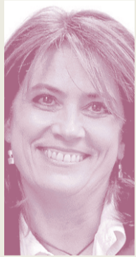
Dolores Delgado Justicia