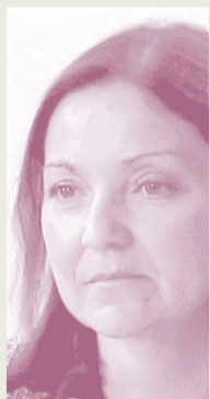
Reyes Maroto Industria, Comercio y Turismo