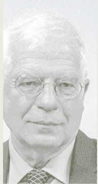
Josep Borrell Asuntos Exteriores, UE y Cooperación