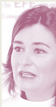
Carmen Montón Sanidad, Consumo y Bienestar Social