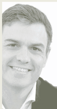
Pedro Sánchez Presidente del Gobierno

Hace historia con una apuesta por la igualdad y la diversidad con 11 mujeres y seis hombres