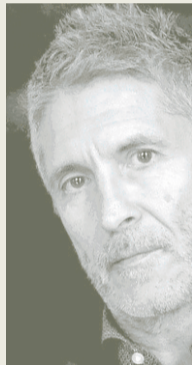
Fernando Grande- Marlaska Interior