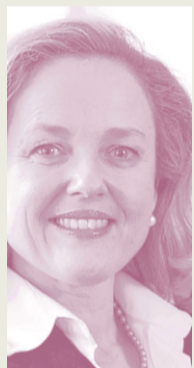
Nadia Calviño Economía y Empresa