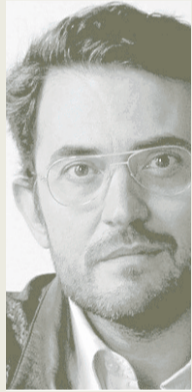
Màxim Huerta Cultura y Deporte