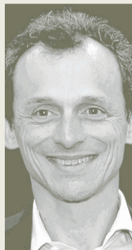
Pedro Duque Ciencia, Innovación y Universidades