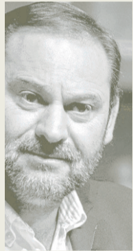
José Luis Ábalos Fomento