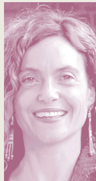
Meritxell Batet Política Territorial y Función Pública