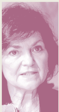
Carmen Calvo Vicepresidenta, Presidencia y ministra de Igualdad