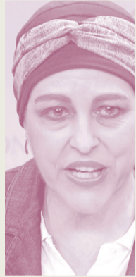
Magdalena Valerio Trabajo, Migraciones y Seguridad Social

El presidente elige a profesionales de perfil progresista y sólo a 4 miembros de su ejecutiva