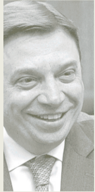
Luis Planas Agricultura, Pesca y Alimentación