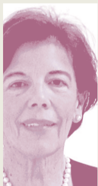
Isabel Celaá Portavoz del Gobierno, Educación y Formación Prof.