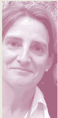
Teresa Ribera Transición Ecológica