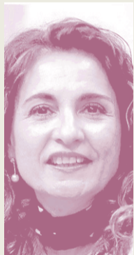
María Jesús Montero Hacienda