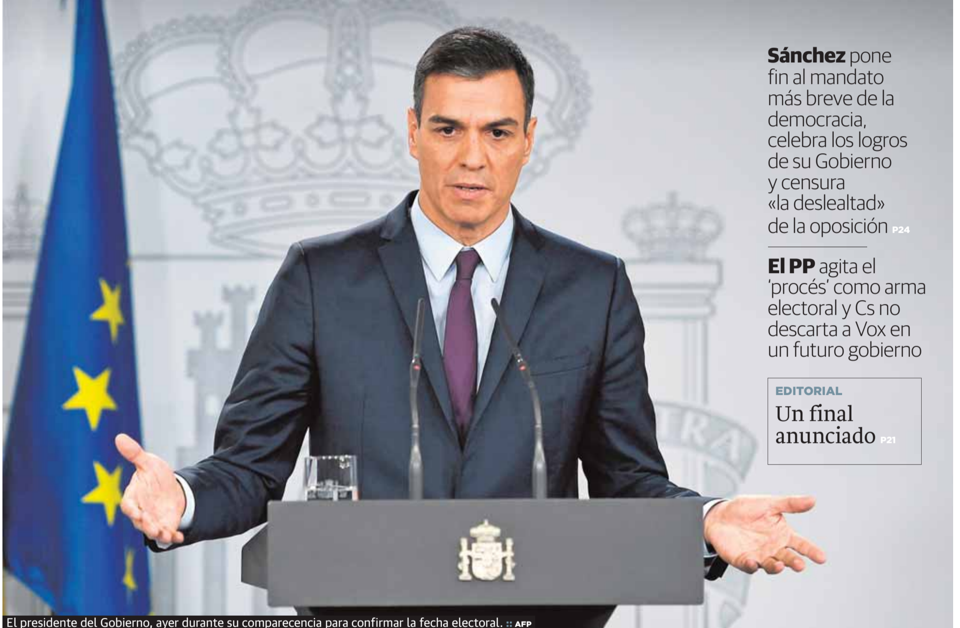
El presidente del Gobierno, ayer durante su comparecencia para confirmar la fecha electoral.

Sánchez pone fin al mandato más breve de la democracia, celebra los logros de su Gobierno y censura «la deslealtad» de la oposición P24