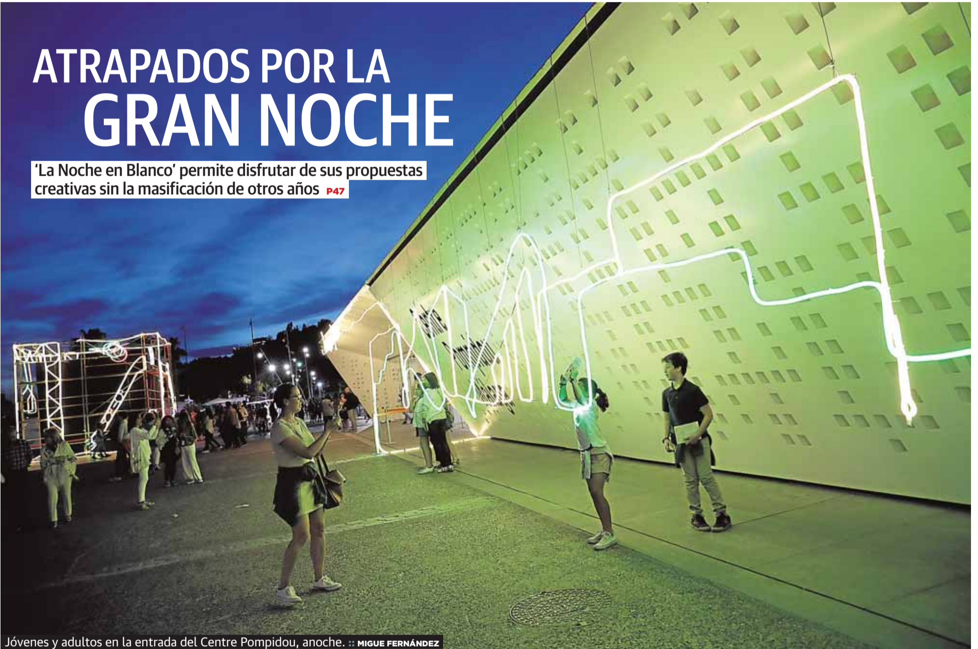
Jóvenes y adultos en la entrada del Centre Pompidou, anoche.

'La Noche en Blanco' permite disfrutar de sus propuestas creativas sin la masificación de otros años P47