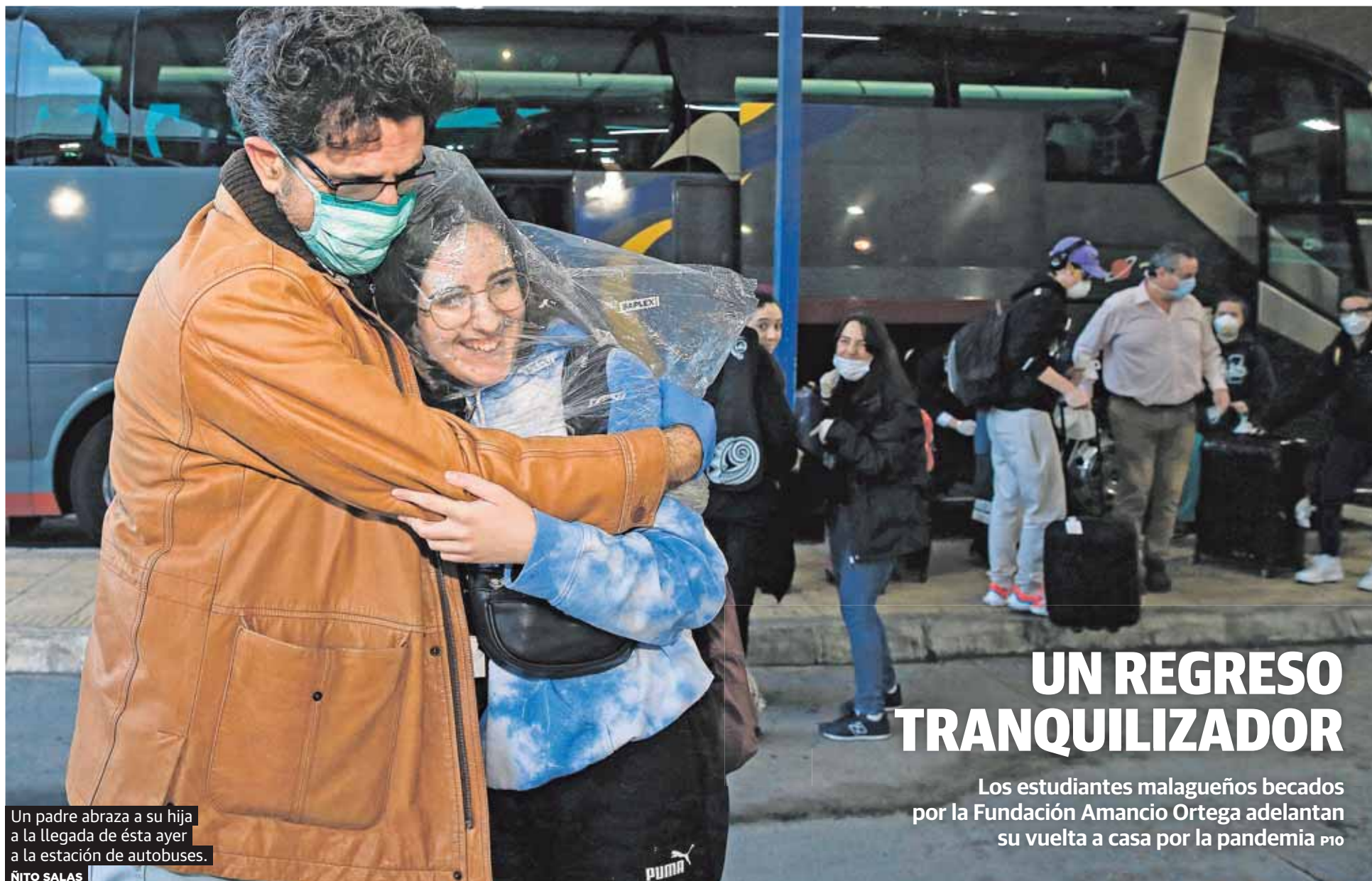
Un padre abraza a su hija a la llegada de ésta ayer a la estación de autobuses.