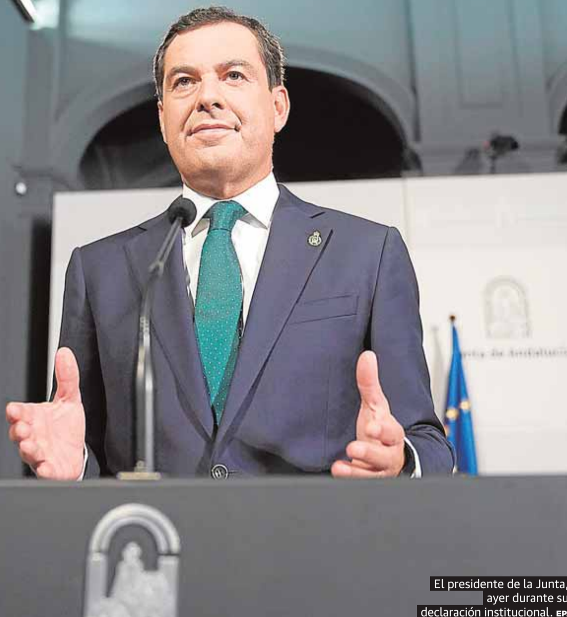
El presidente de la Junta, ayer durante su declaración institucional.

Moreno advierte de que las cifras de contagio en la comunidad «son como las del 4 de abril, pero entonces la curva empezaba a bajar»