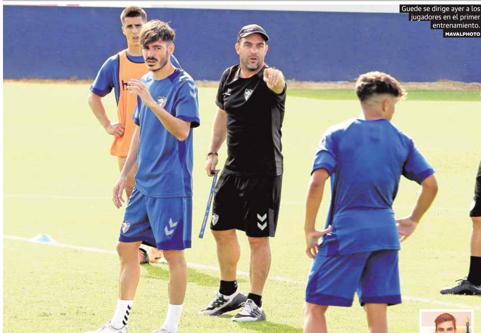
Guede se dirige ayer a los jugadores en el primer entrenamiento.

presidente de Renfe rechazó que Málaga sufra agravio respecto a otras capitales, pero no precisó calendario de normalización. P2